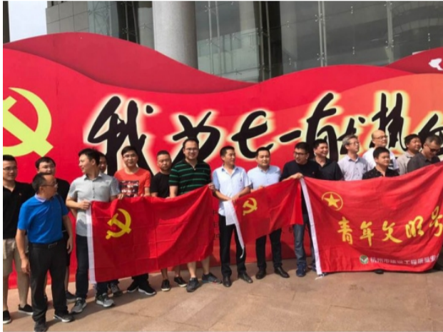
7月1日,杭州大型公益活动“我为七一献热血”,在浙江省人民大会堂举行,此次活动也是集团第二工程分公司杭州

丁桥中医院项目党支部与杭州市建设工程质量安全监督站第一党支部开展的携手联建,不断提高党建联建工作水平,真正实现资源共享、文明共建、和谐共创的新局面,推进“两学一做”学习教育成果。据统计,当天项目党支部共9人参加献血,献血量达到1900ml。