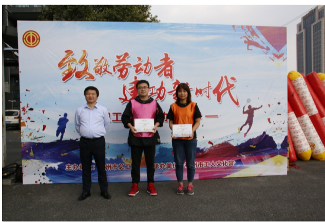
二等奖:集团一队、广通劳务队