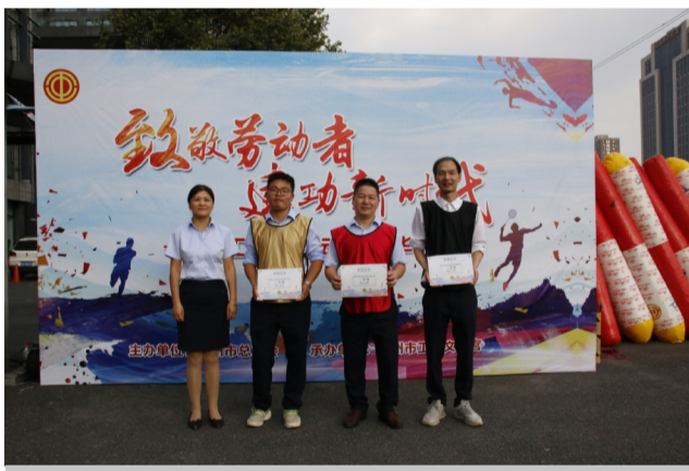
三等奖:集团三队、集团四队、集团五队