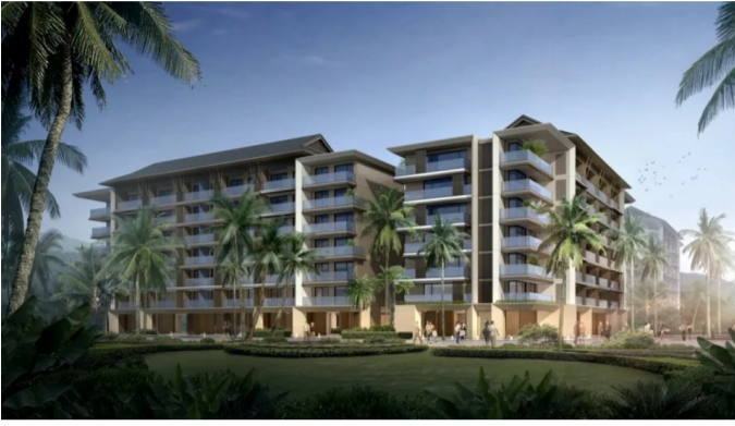
工的品牌在七彩云南的大地上做强做大。 (三分公司 严国胜)

悦景庄·桃源里风荷组团二标项目是杭州建工目前在云南最大的一个项目,也是和蓝绿双城的又一次强强合作。杭州建工集团从中标之日起就尽心统筹协调,组建了强有力的管理团队,精心制定了严密的施工计划,确保严格按照施工规范、工艺流程、质量标准体系组织施工,以“高起点、高品位、高质量”的定位将桃源里风荷组团打造成为精品工程、标杆工程,把杭州建